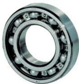
Roulement ouvert ( )